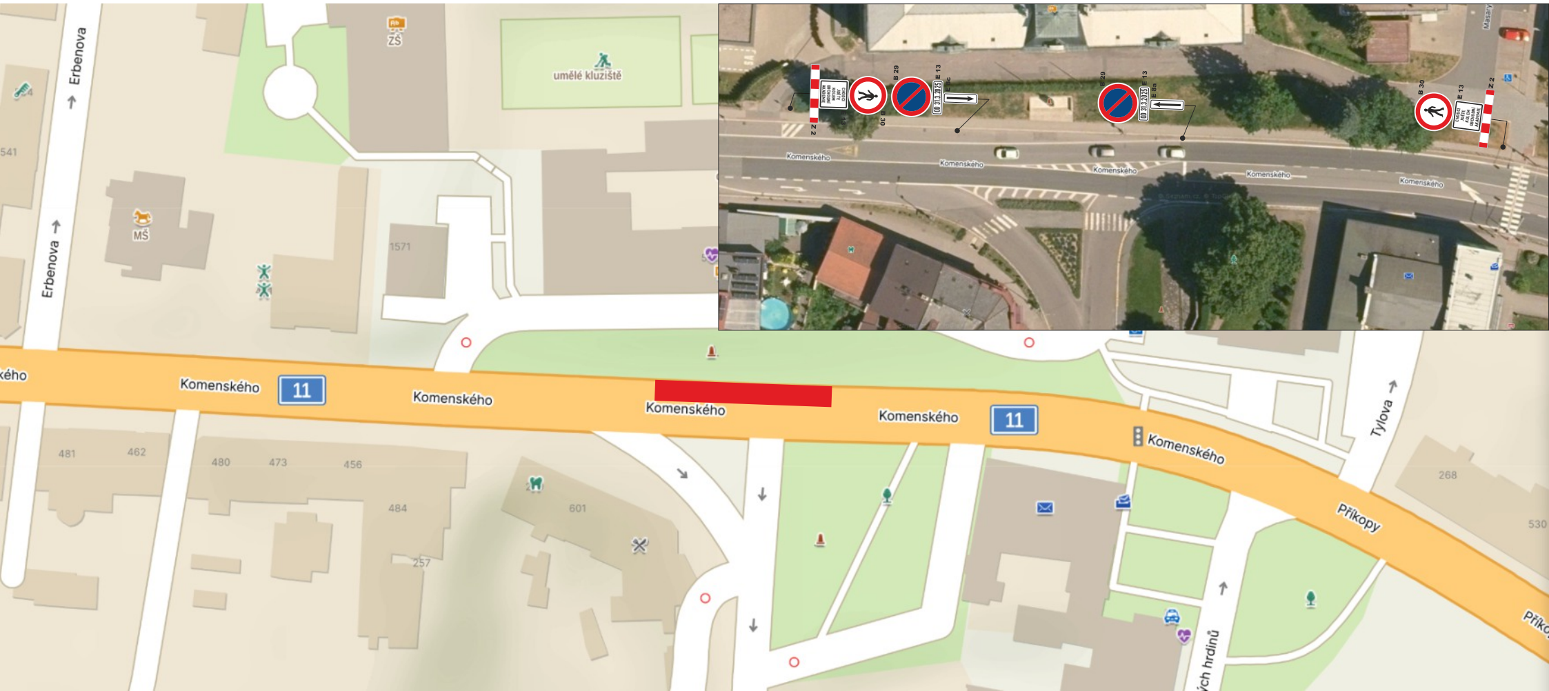
SCHÉMA DZ - INTRAVILÁN