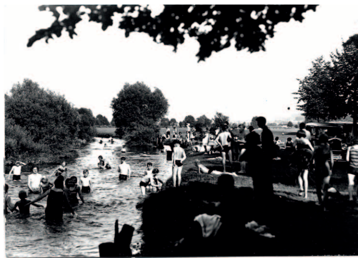
Přírodní plovárna na náhonu U VRBY