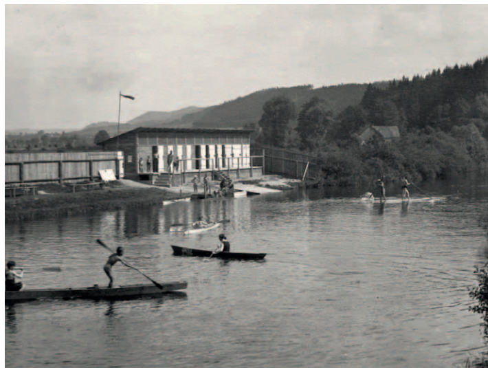
Plovárna nad splavem

trati a náhonem elektrárny firmy J. a A. Nejedlý. Po prohlédnutí staveniště musel být projekt doplněn o další kritéria. Podle doplněného projektu mělo být koupaliště zřízeno na obecní louce, kde měly být vyhloubeny bazény pro plavce 30 x 50 m, pro neplavce 30 x 10 m a kruhové brouzdaliště pro děti o průměru 11,35 m s celkovou kubaturou 3000 m 3 . Zemský úřad v Praze udělil vodoprávní výměr pro stavbu teprve 9. prosince 1935, ale to bylo již pozdě.