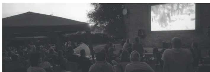
Letní kino Rabštejn - film Špunti na vodě

S programem Letního kina Rabštejn se budete moci seznámit na stránkách www.skrabstejn.cz , na výlepkových plochách, na sociálních sítích a samozřejmě v prázdninovém čísle zpravodaje. Vstupenky budou k dispozici také ONLINE.