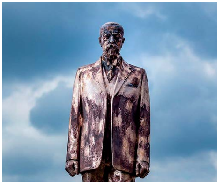
Umělečtí slévači z Horní Kalné odlili sochu T. G. Masaryka, nyní ji cizelují.