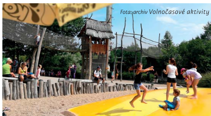
Fota: archiv Volnočasové aktivity

Byly nám nabídnuty další možnosti, jak pracovat s rodinami a dětmi. Nejedná se už jen o výlučně romské rodiny, ale šanci dostali všichni. Také máme více rodin a dětí.