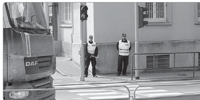
Každodenní preventivní dohled strážníků na přechodu pro chodce v ranních hodinách. Jedná se o nejméně frekventovaný přechod pro chodce, křižující páteřní komunikaci I/11, který hojně využívají školáci.