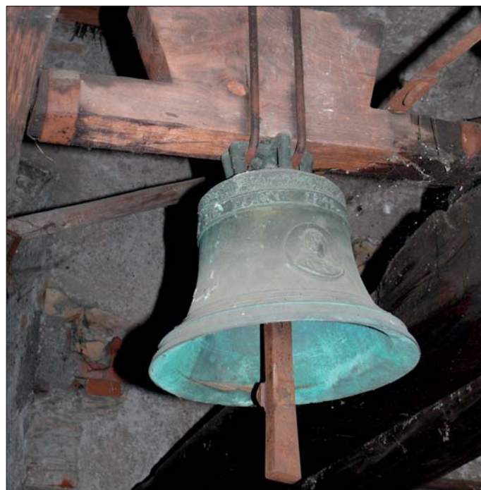
Foto: Umíráček z roku 1841 s nápisem a reliéfem.