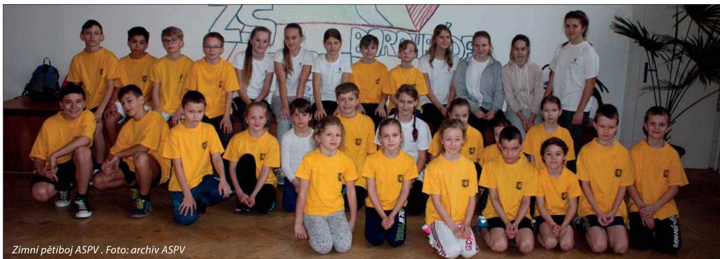
Zimní pětiboj ASPV.