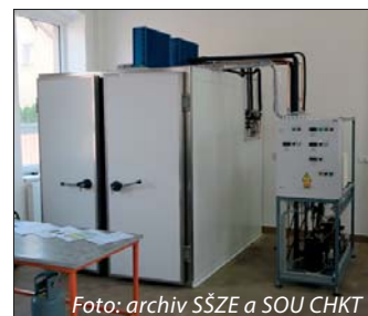
Celkový pohled na zařízení, které je umístěno v nově zrekonstruovaných prostorách

Hlavním důvodem, proč jsme byli do Kostelce pozváni, bylo spuštění nového cvičného zařízení od firmy JDK Nymburk, které by mělo zkvalitnit výuku a přípravu mechaniků CHKT se zaměřením na pochopení funkce chladicích okruhů chladíren a mrazíren, demonstrovat základy řízení chladicích okruhů s jedním a více kompresory, umožnit provádět změny nastavení přístrojů, regulačních prvků a parametrických regulátorů a sledovat změny chování chladicích okruhu. Žáci budou provádět technická měření na chladicím okruhu s cílem naučit se správně analyzovat a vyhodnocovat získaná data. Na okruhu lze simulovat závady s cílem naučit žáky správnému postupu při jejich vyhledávání a odstraňování a osvojit si zá-