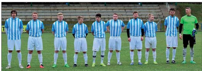
Předzápasové foto – zápas s Libčany