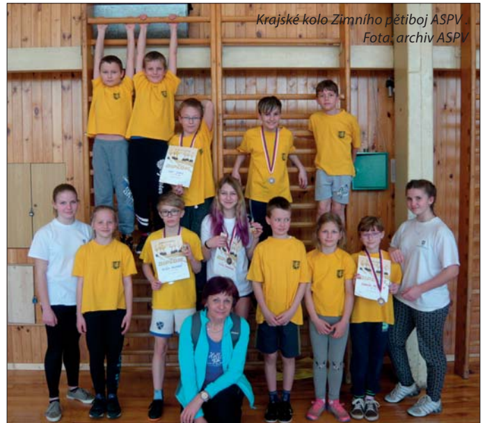
Krajské kolo Zimního pětibože ASPV

Na aprílovou sobotu se opravdu konaly krajské závody ASPV v zimním pětiboží, ve kterých jsme posbírali několik medailí a diplomů, ze kterých měli závodníci určitě radost.