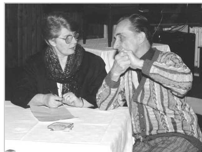
PORADA JAK ZAČÍT CELOVEČERNÍ PROGRAM