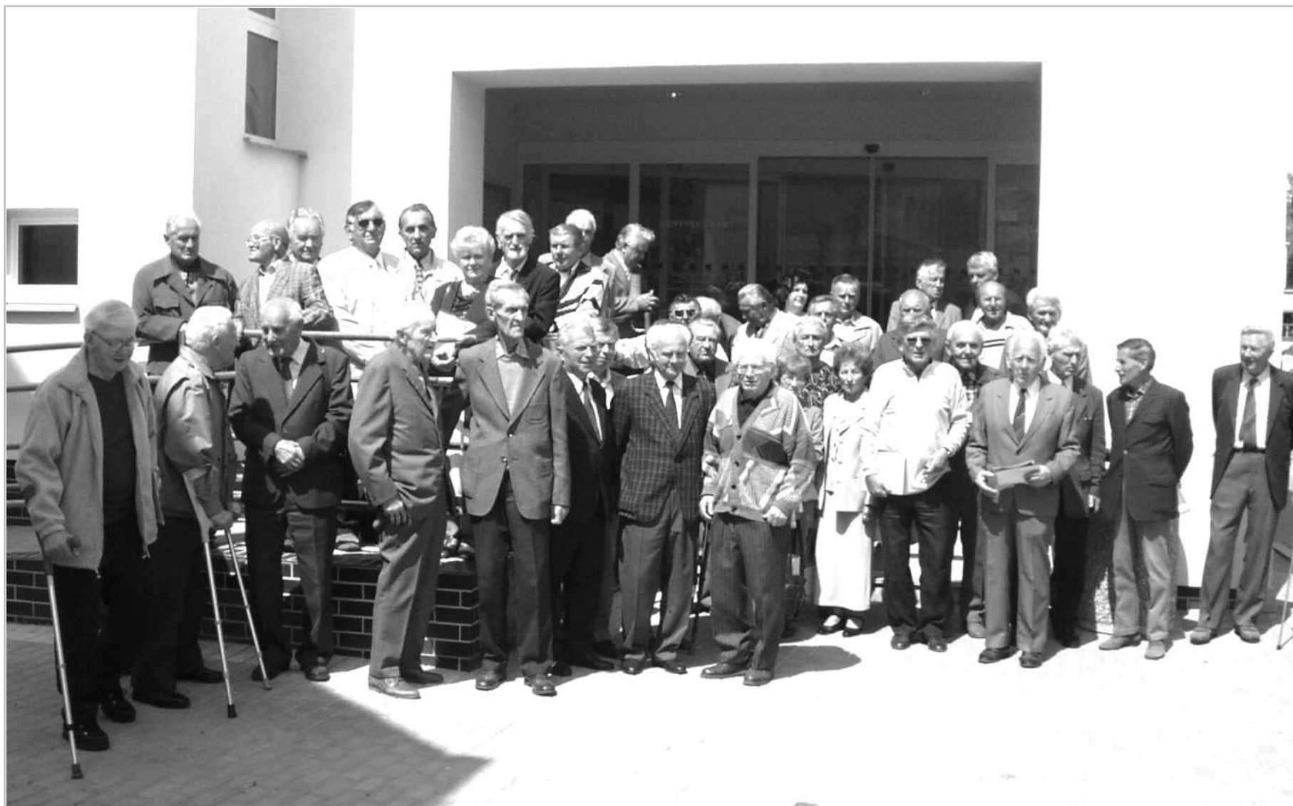
PŘEDÁNÍ MEDAILÍ MĚSTA SPORTOVČŮM – SENIORŮM 16.5.2003