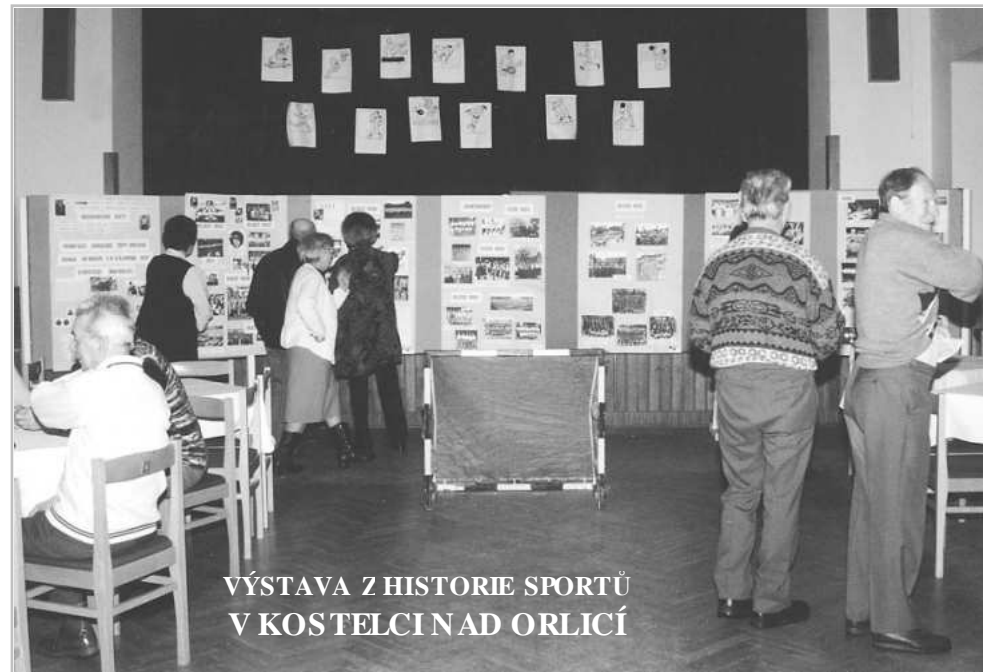
VÝSTAVA Z HISTORIE SPORTŮ V KOSTELCI NAD ORLICÍ