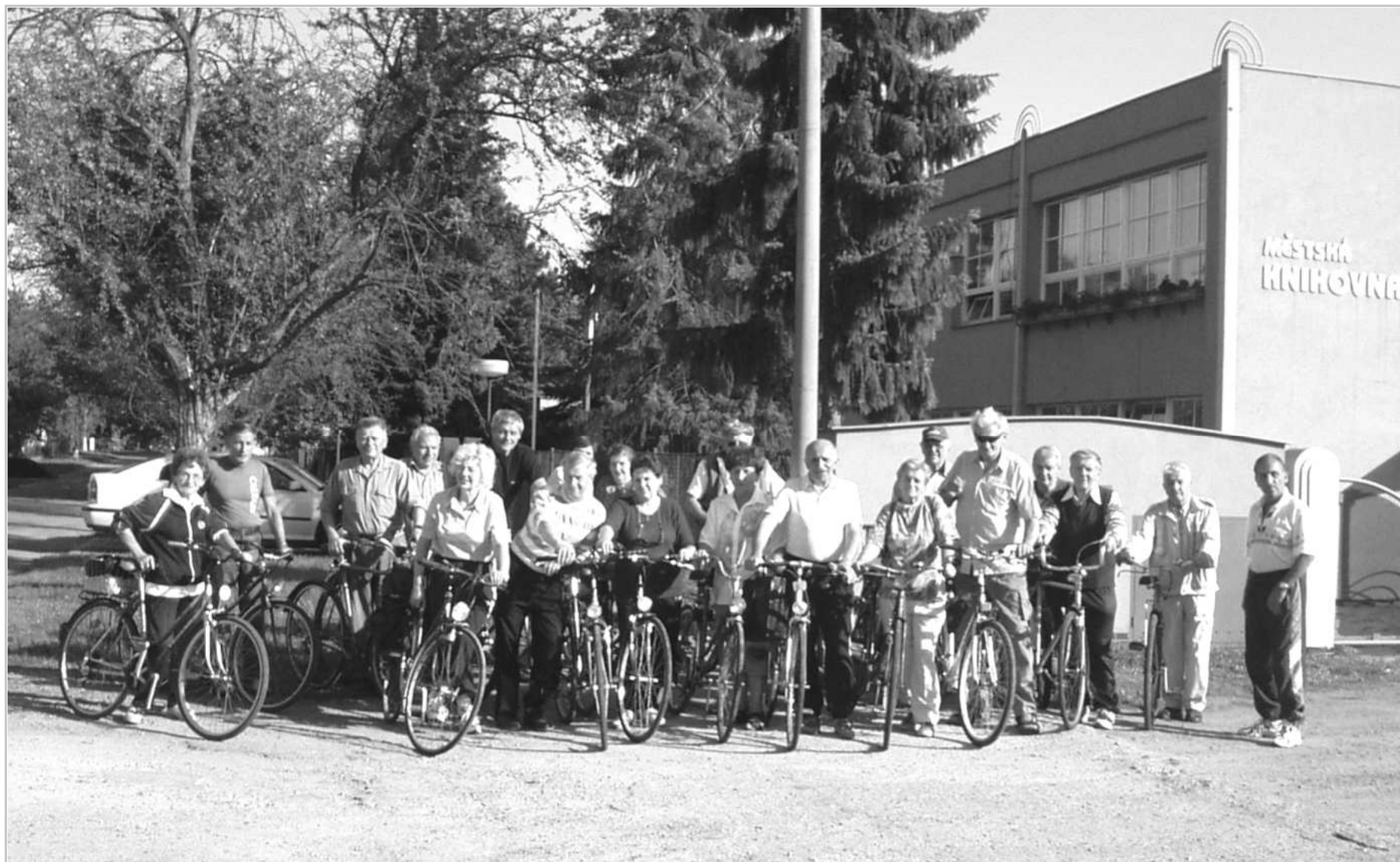
SPORTOVNÍ AKTIVITA – CYKLISTICKÝ VÝLET NA VRBICI – START U KNIHOVNY 18.9.2003