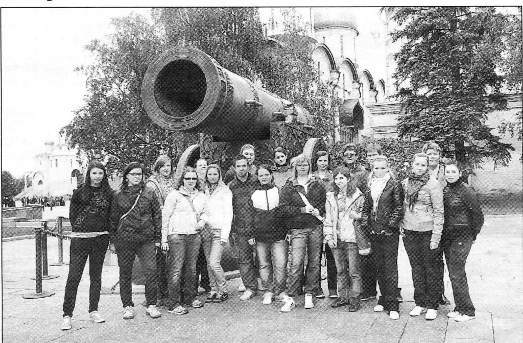
Car – puška byl největším dělem svého druhu na světě.