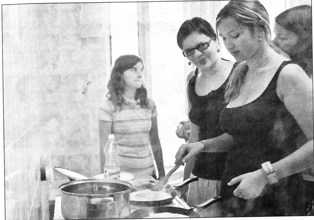
Součástí stáže bylo společné vaření tradičních ruských jídel.